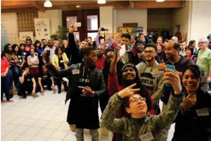
Rencontre internationale jeunesse à Dunkerque sur le thème : « Le Clj, espace pour passer de la Colère à la Démocratie »