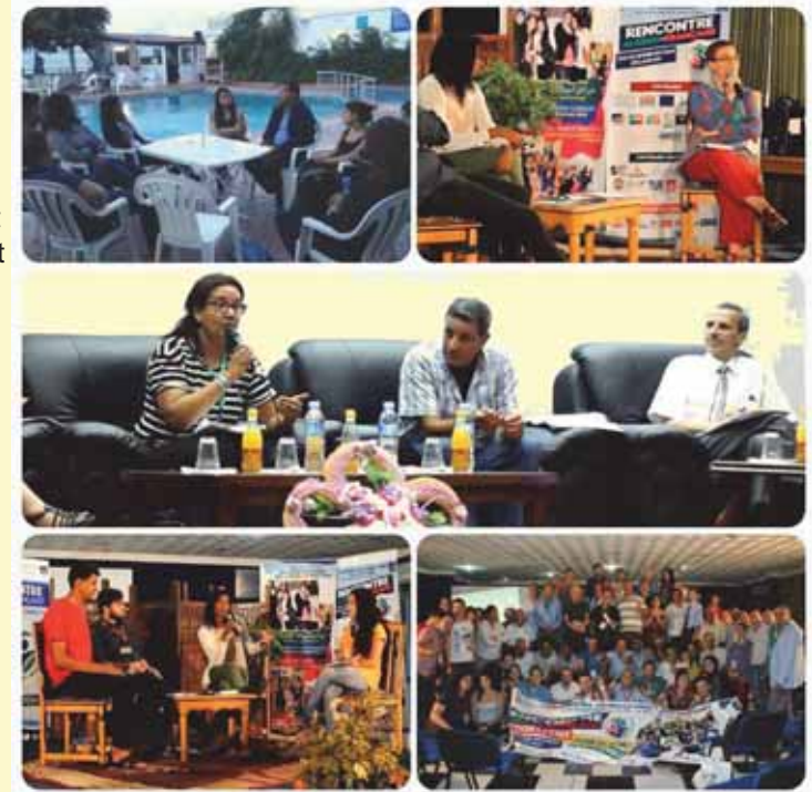
Rencontre avec des jeunes du Conseil de jeunes de Berlin en partenariat avec l'Ofaj sur le thème : « Engagé sur son quartier »

A l'issue des travaux en ateliers thématiques, une feuille de route a été co-rédigée pour servir de points d'appui pour une co-construction d'un programme d'actions Algéro-français sur les questions liées à la jeunesse.