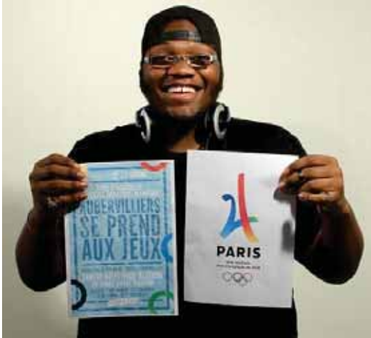
Le clj se mobilise pour la candidature de Paris aux JOP2024