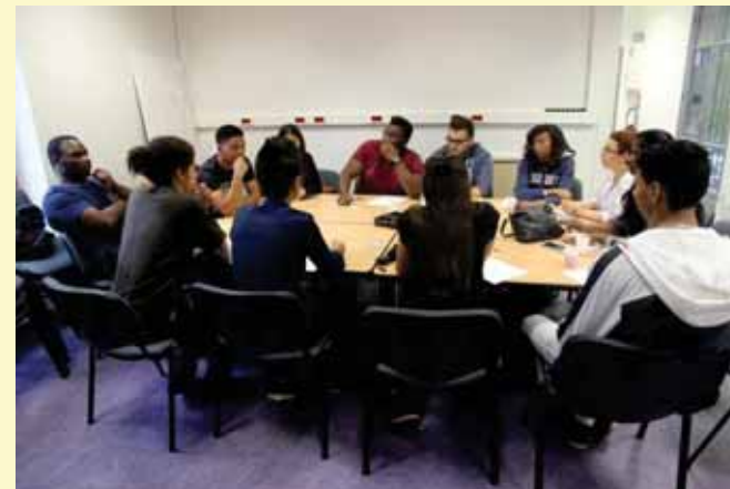
Une réunion de travail en commission

La fréquence des réunions des commissions est variable selon les projets travaillés. Les groupes sont encadrés par la chargée de mission jeunesse, le tout coordonné par le responsable du service jeunesse de la Ville.