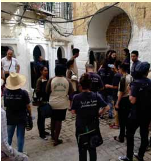
Un espace, un temps, une thématique : Deux rives, un rêve, pour mettre en synergie des jeunes du CLJA et de SOS Bab El Oued en Algérie.

Des jeunes du CLJA ont été associés à la rencontre internationale et aux travaux sur les actions locales pour et avec les jeunes en partenariat avec Cités Unies France en Algérie.