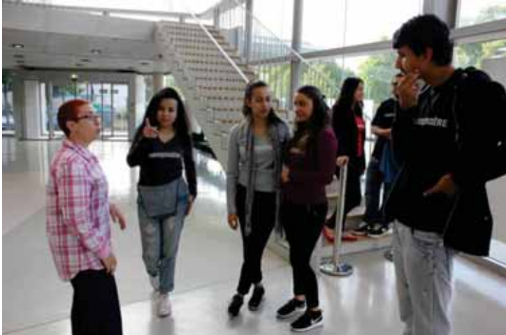
Partenariat avec l'Embarcadère pour l'accueil du public sur des événements culturels

Des jeunes du CLJA apportent leur contribution utile au service d'un événement, d'une manifestation ou d'une action, qui renforcera leur estime de soi et surtout pour exprimer leur intérêt à l'égard d'une cause et d'un agir ensemble pour sa ville et sa jeunesse.