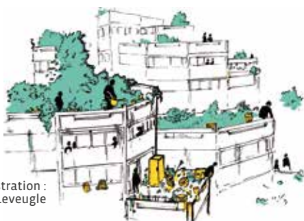
Illustration : Jean Leveugle

À la Maladrerie, si la dégradation des bâtiments est un constat partagé par tous, tous n'ont pas le même avis sur ce site si particulier : pour les uns, l'architecture révolutionnaire de Renée Gailhoustet procure une grande liberté. Pour les autres, elle est une contrainte au quotidien.